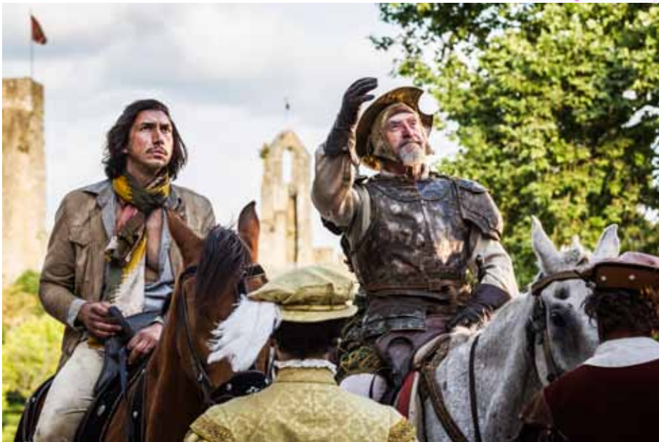
L'homme qui tua Don Quichotte