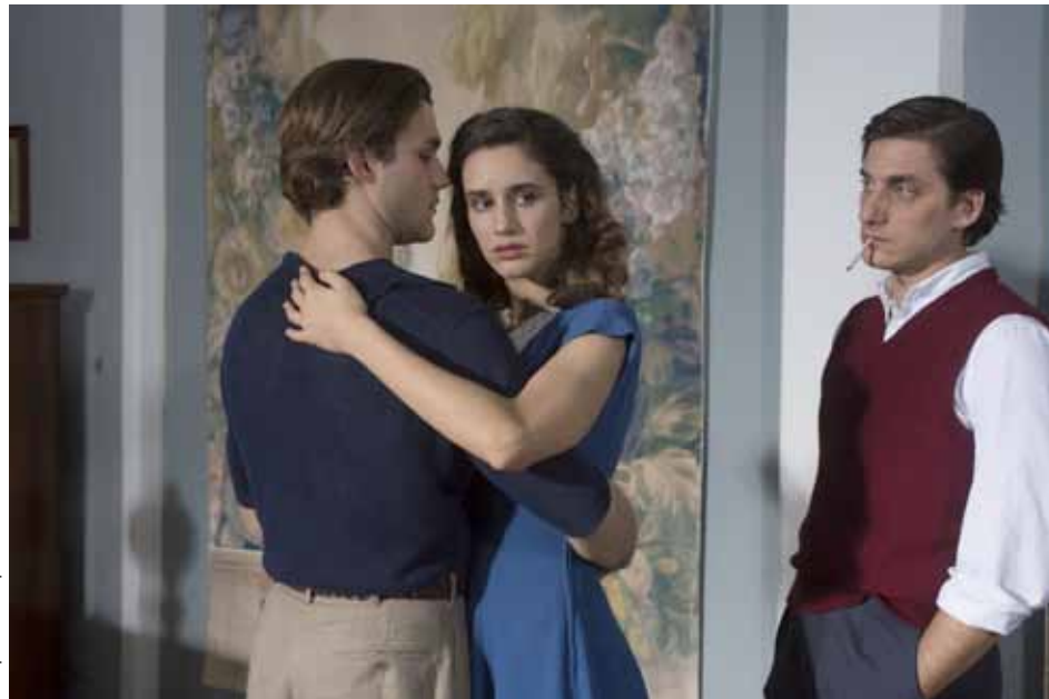
Una questione privata