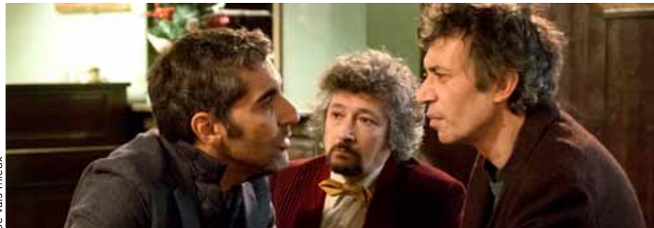
Je vais mieux