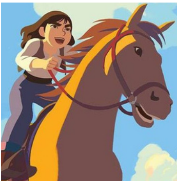
Calamity, une enfance de Martha Jane Canary