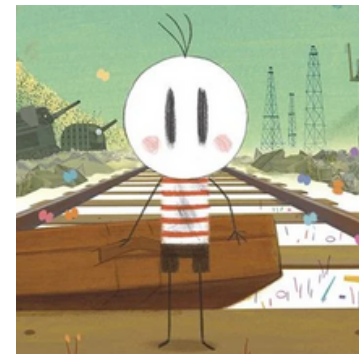
Le garçon et le monde