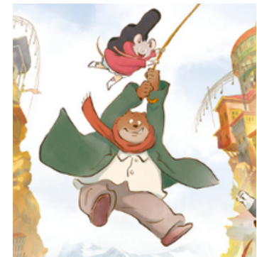
Ernest et Célestine