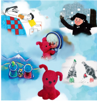
Un peu d'imagination !