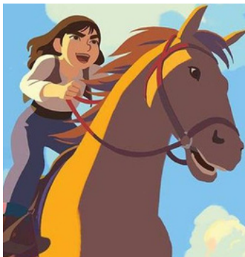
Calamity, une enfance de Martha Jane Canary