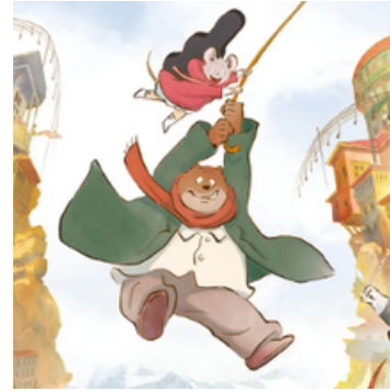
Pour la Grande Section Ernest et Célestine