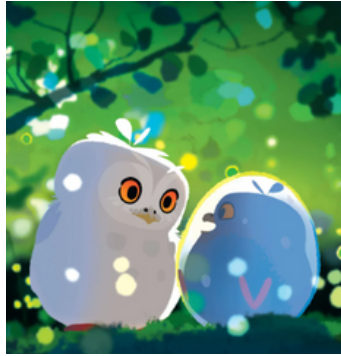
L'Odyssée de Choum